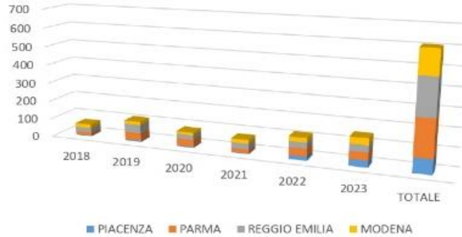
OCC Emilia Procedure 2018-2023